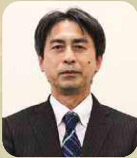
伊勢税務署長 辻 隆生