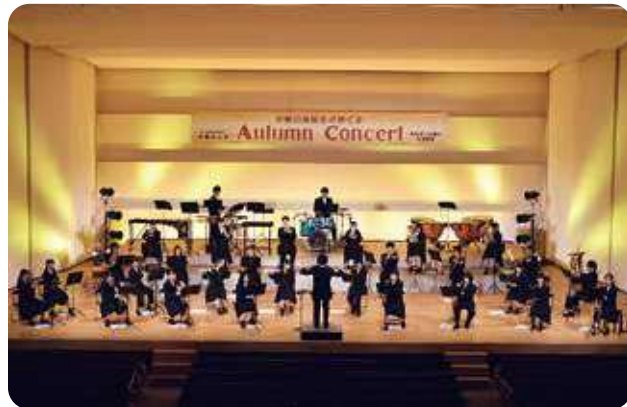
♪♪♪ 宇治山田高校 吹奏楽部 ♪♪♪