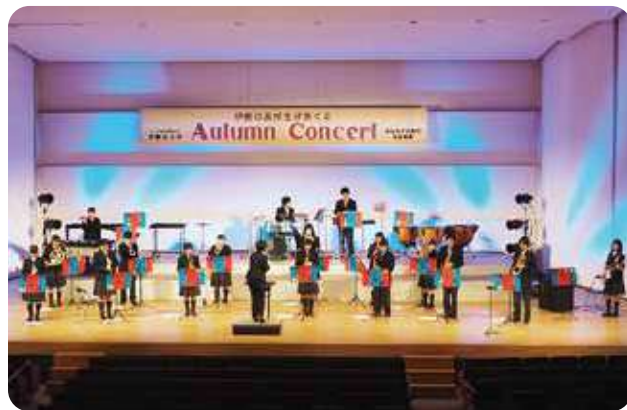
♪♪♪ 伊勢学園高校 吹奏楽部 ♪♪♪