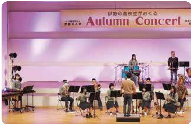
♪♪♪ 伊勢工業高校 吹奏楽部 ♪♪♪