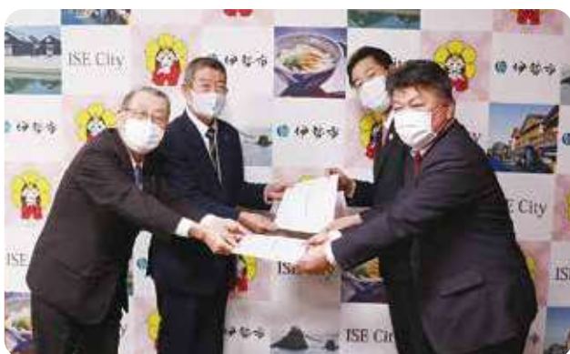
伊勢市 市長・議長