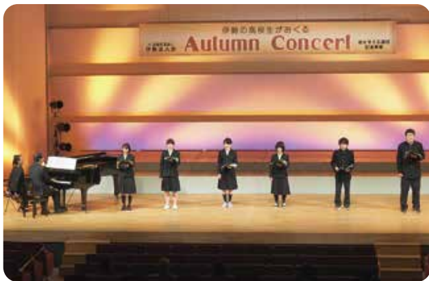
♪♪♪ 伊勢高校 合唱部 ♪♪♪