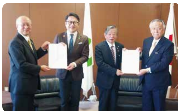
志摩市 市長・議長