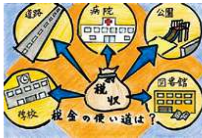
🌸 伊勢法人会税制委員長賞