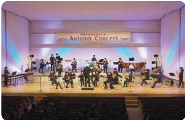
♪♪♪ 伊勢高校 吹奏楽部 ♪♪♪