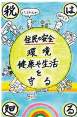
🌸 伊勢税務連絡協議会長賞