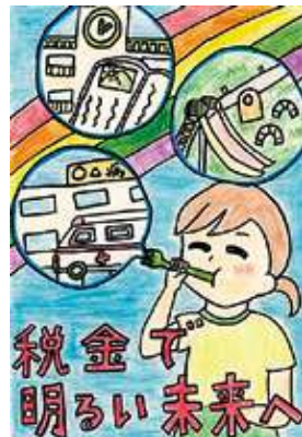
🌸 伊勢法人会会長賞