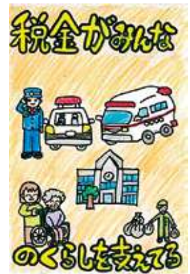
🌸 伊勢法人会 女性部会長賞